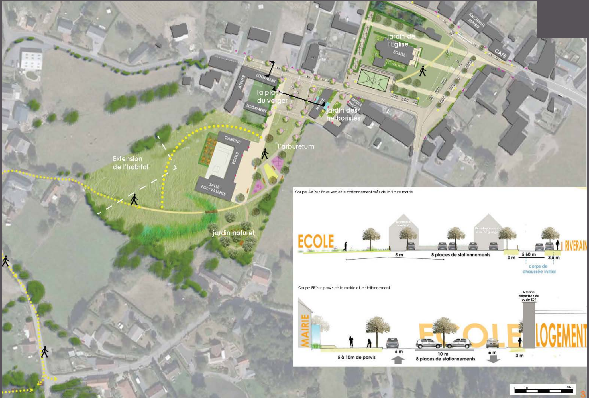
Taisnières sur Hon - étude FDAN cadre de vie - nouvel équipement en coeur de village - 2013