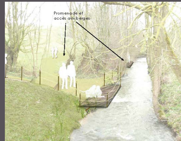
Taisnières sur Hon - étude FDAN cadre de vie - nouvel équipement en coeur de village - 2013